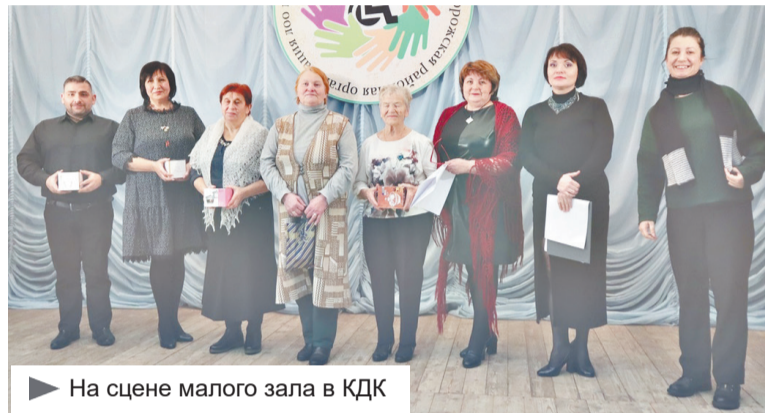
▶ На сцене малого зала в КДК