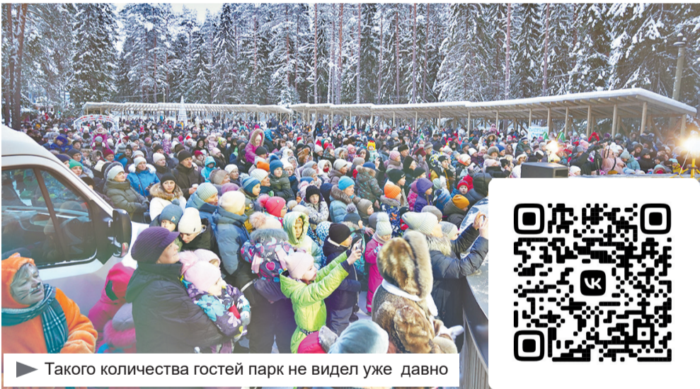
► Такого количества гостей парк не видел уже давно