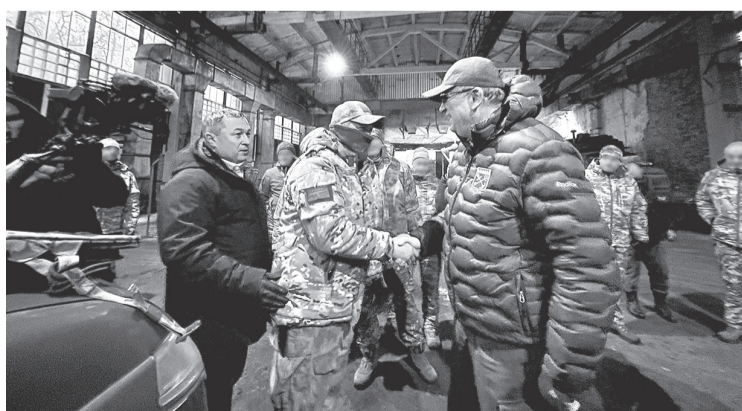
Ремонтный батальон получил необходимое оснащение от Ленинградской области