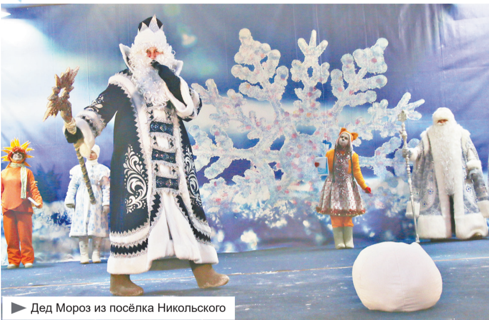
► Дед Мороз из посёлка Никольского