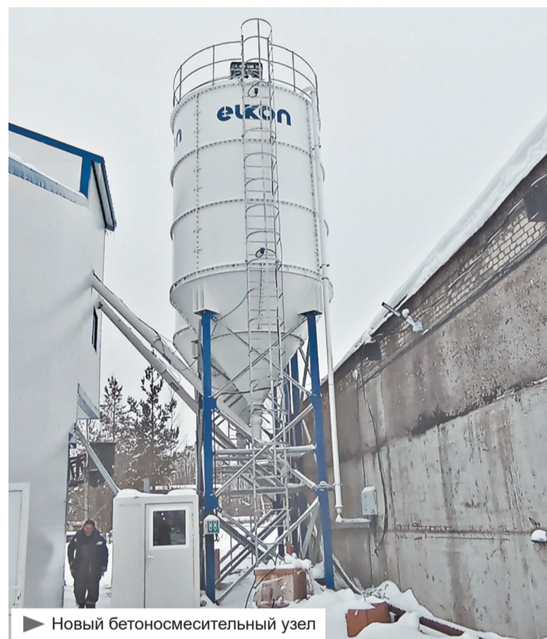
▶ Новый бетоносмесительный узел

Выпускаемый на заводе бетон отвечает самым высоким стандартам качества. Его производство недёшево, так как приходится возить только определённые марки цемента, щебня и песка. Однако это гарантирует надёжность и безопасность железобетонных конструкций. Мостостроение не терпит просчётов и халатности.