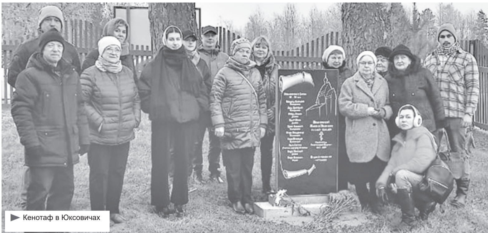
Кенотаф в Юковичах