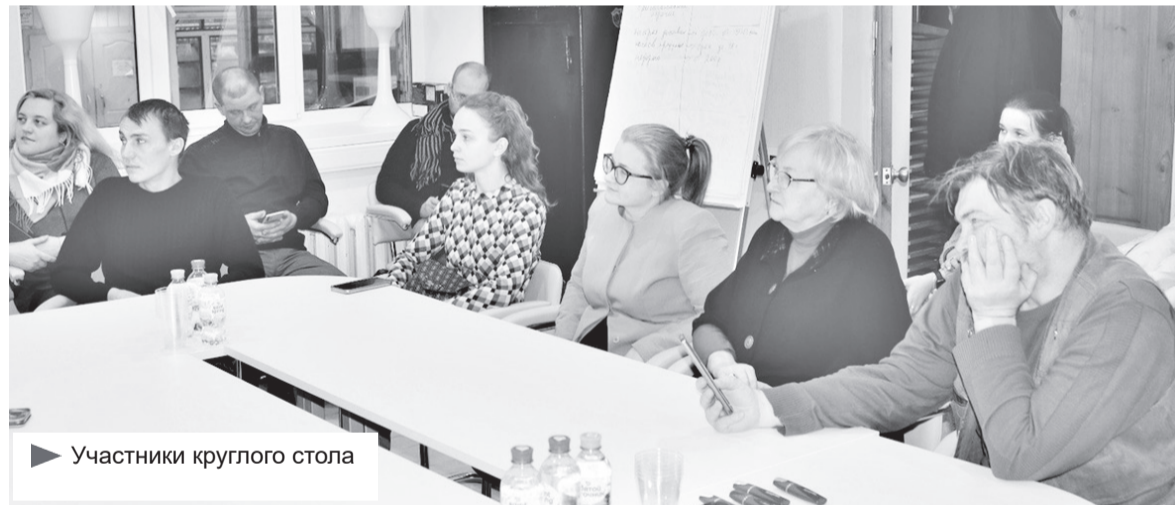
▶ Участники круглого стола

вопросам предпринимательской деятельности и даже бухгалтерское сопровождение по отдельному договору. В социальных сетях ведётся постоянный мониторинг и рассылка актуальной информации, востребованной в бизнес-сообществе.