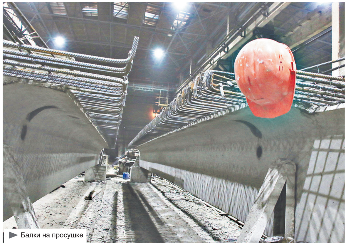
▶ Балки на просушке