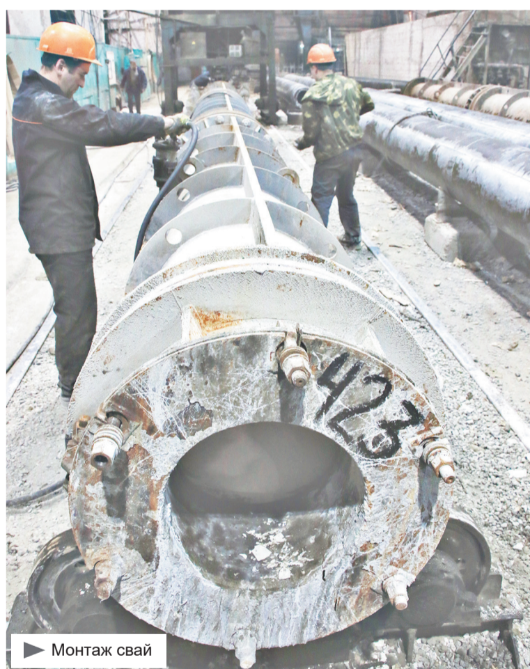
▶ Монтаж сваи

Застали мы и процесс сборки рабочими двенадцатиметровой сваи. Вес этой конструкции в готовом виде почти пять с половиной тонн. Внешне свая выглядит как