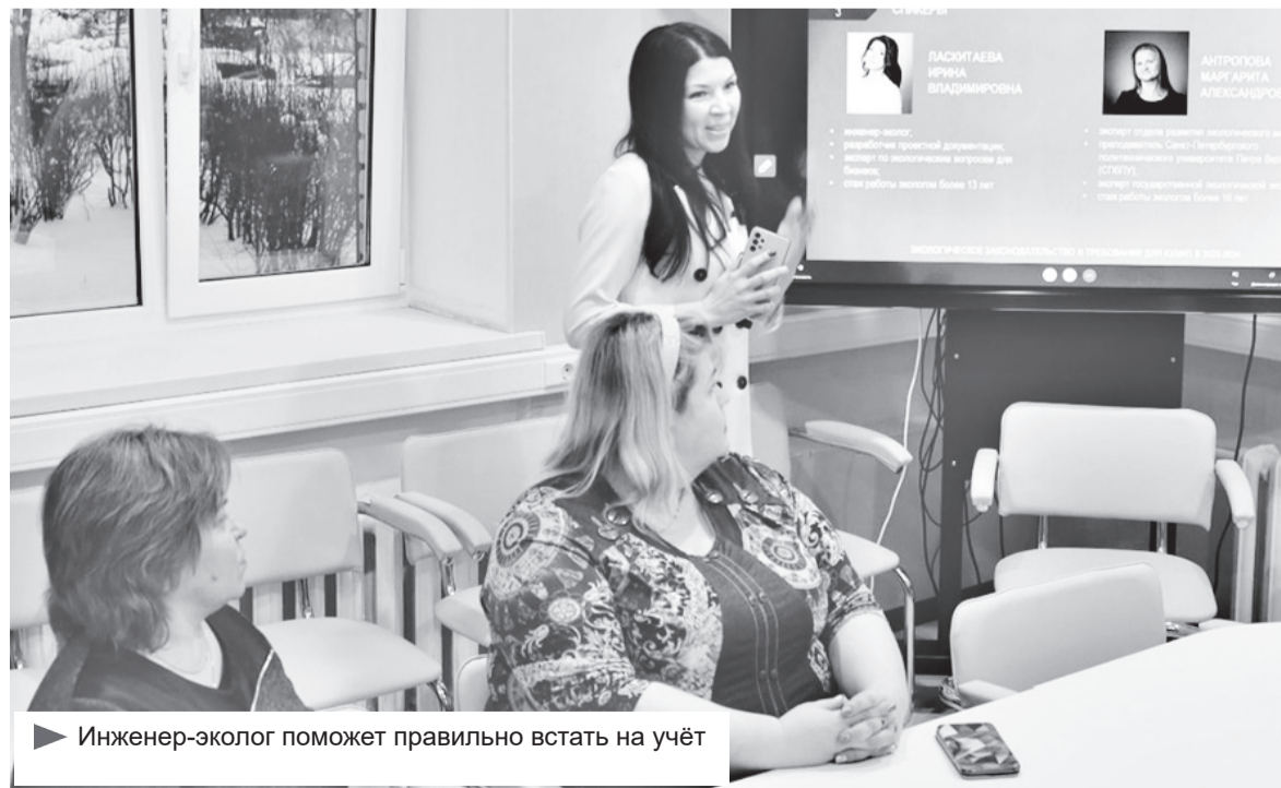
▶ Инженер-эколог поможет правильно встать на учёт